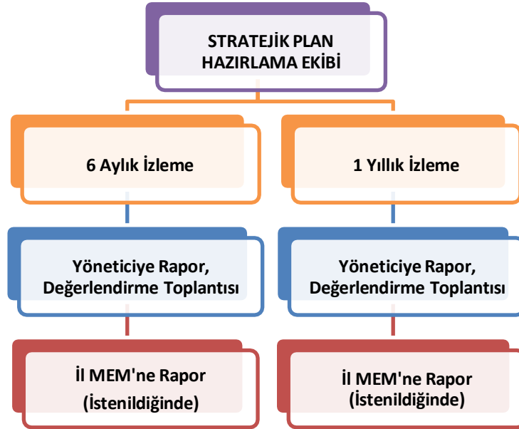
Şekil 2. İzleme ve Değerlendirme Süreci.

Yıllık planın uygulanmasında yürütme ekipleri ve eylem sorumlularıyla aylık ilerleme toplantıları yapılacaktır. Toplantıda bir önceki ayda yapılanlar ve bir sonraki ayda yapılacaklar görüşülüp karara bağlanacaktır.